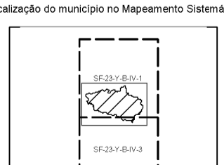
Fonte: Mapa Índice do Brasil - IBGE