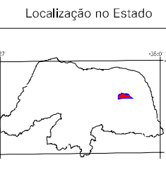
Localização no Estado