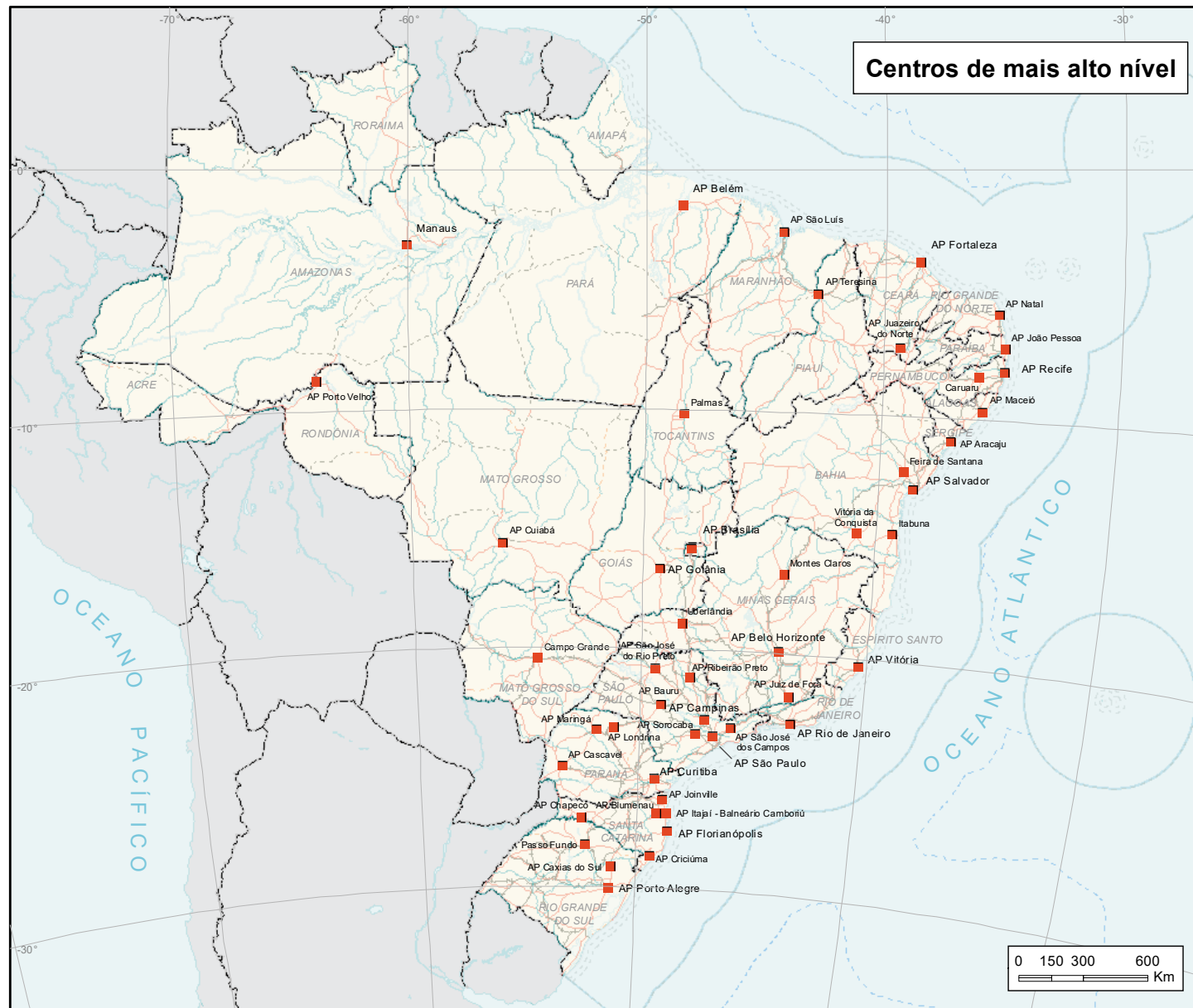
Mapa 3 - Índice-legenda dos centros de mais alto nível