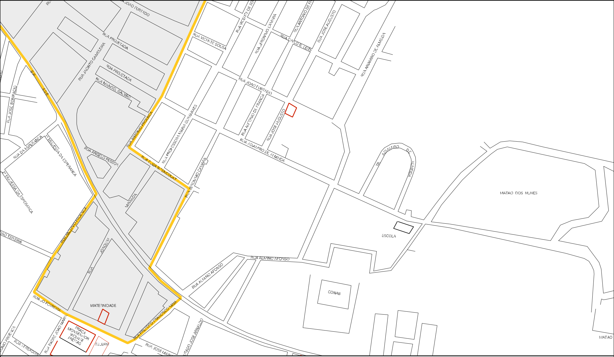
ESTADO DO RIO GRANDE DO NORTE MAPA DE SETOR URBANO - MSU ESCALA: 1 : 5384