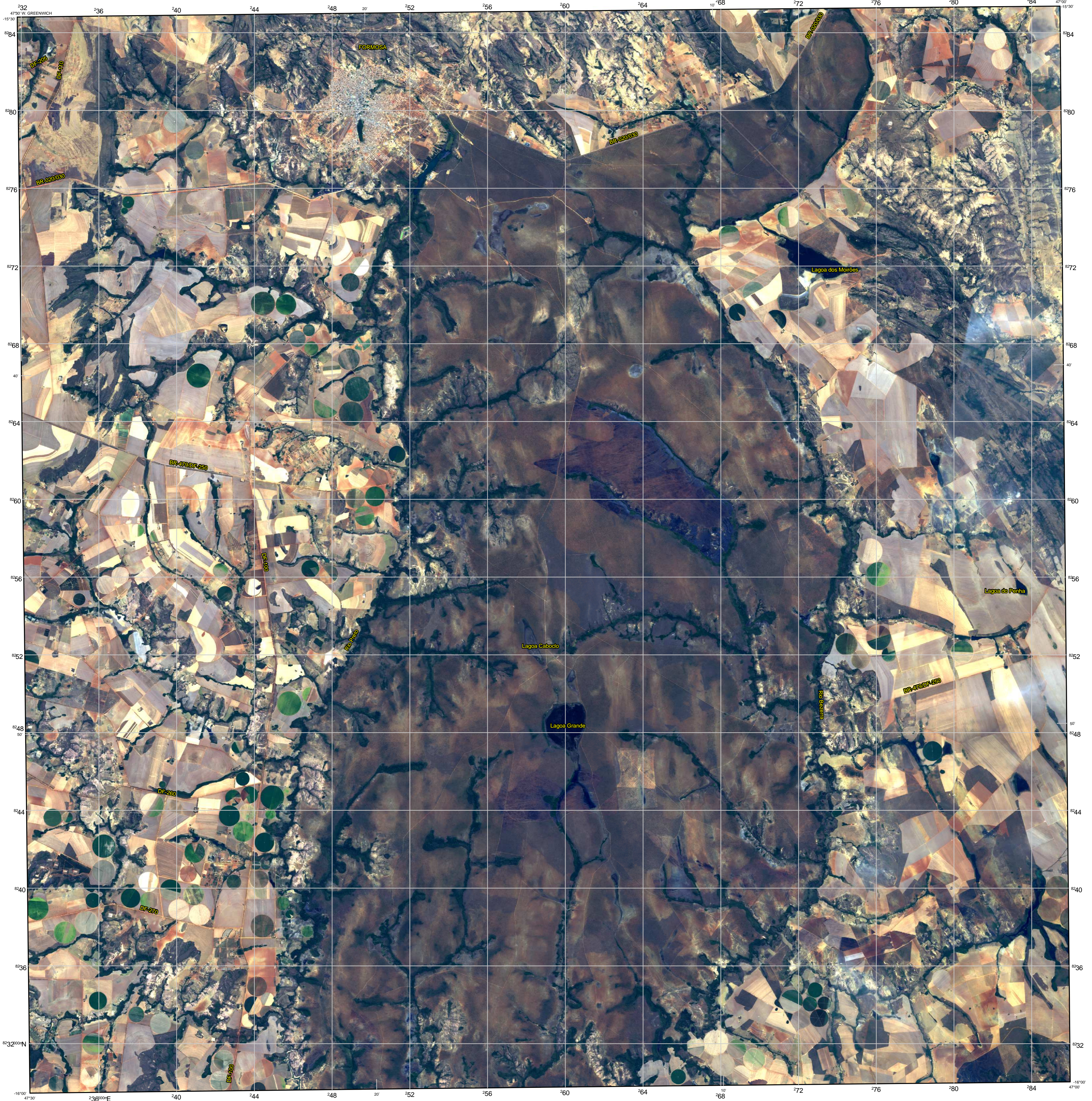
LOCALIZAÇÃO DA FOLHA NO ESTADO DE GOIÁS