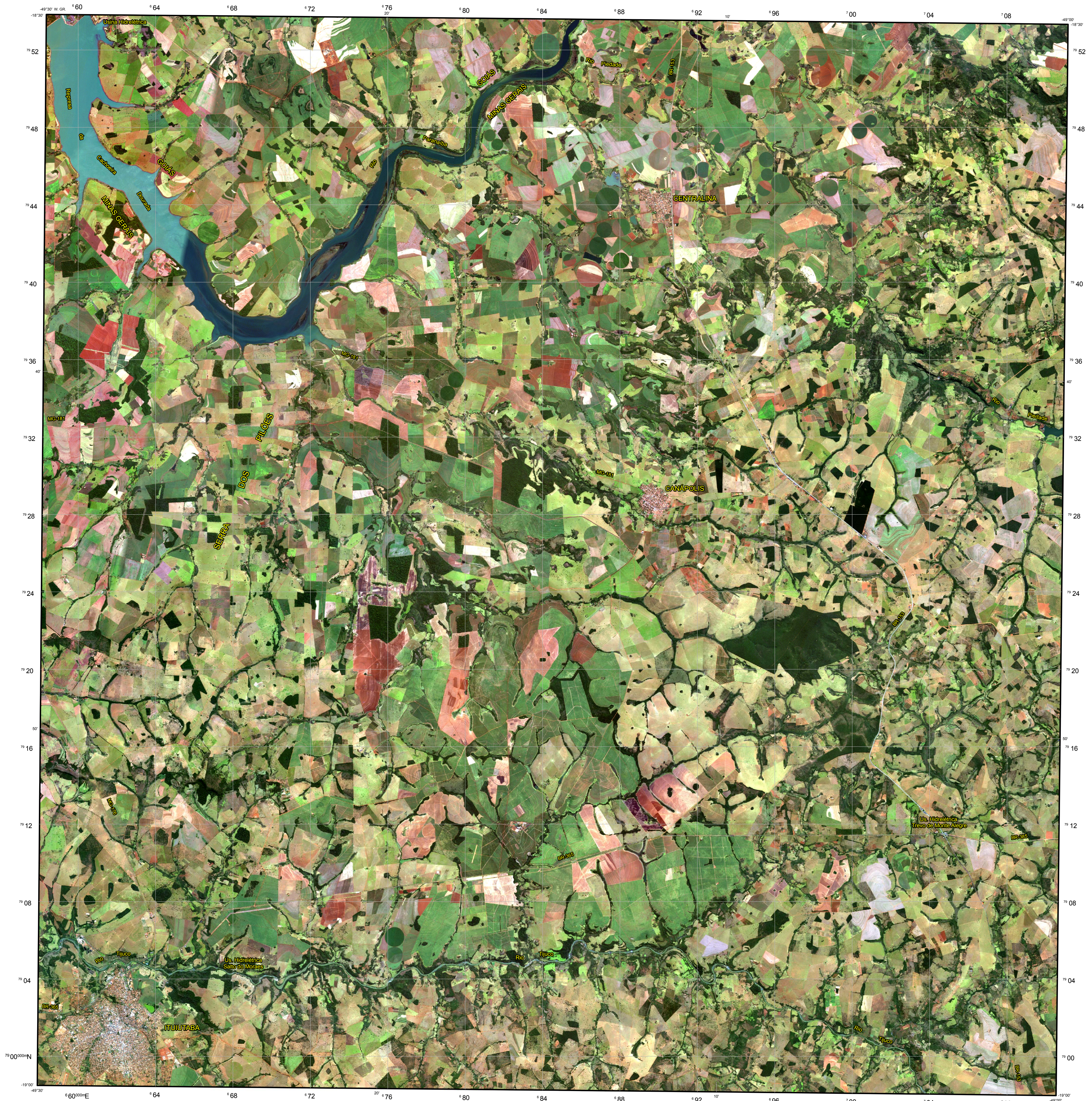
LOCALIZAÇÃO DA FOLHA NO ESTADO