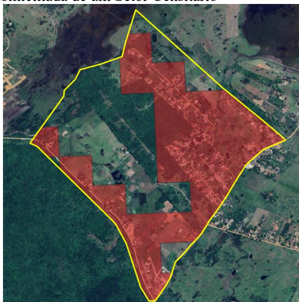
Figura 1 Área efetivamente domiciliada de um Setor Censitário

Os dados de áreas efetivamente domiciliadas dos Setores Censitários foram apenas divulgados em situações territoriais urbanas devido ao fato de ter sua funcionalidade prioritariamente dentro do contexto urbano, em particular em áreas de franja urbano-rural, tal qual descrito nos parágrafos anteriores.